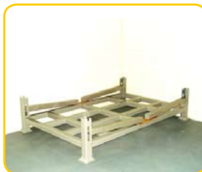
Paleta kłonicowa, składana