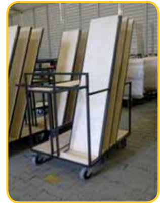
Wózek do komponentów - branża motoryzacyjna