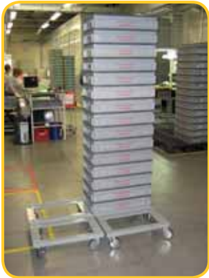
Wózek do przewozu skrzynek