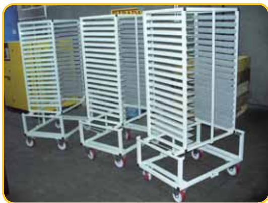
Wózek do komponentów - branża AGD