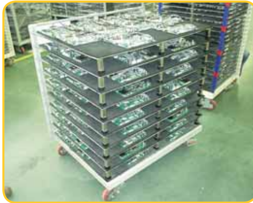
Wózek do komponentów - branża elektroniczna