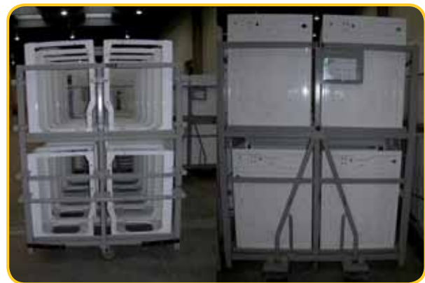
Wózek do komponentów - branża AGD

Przedstawione produkty to przykładowe realizacje naszej firmy. Wykonujemy wszelkie modyfikacje na specjalne zamówienie klienta. Własny dział projektowy gwarantuje Państwu fachowe doradztwo.